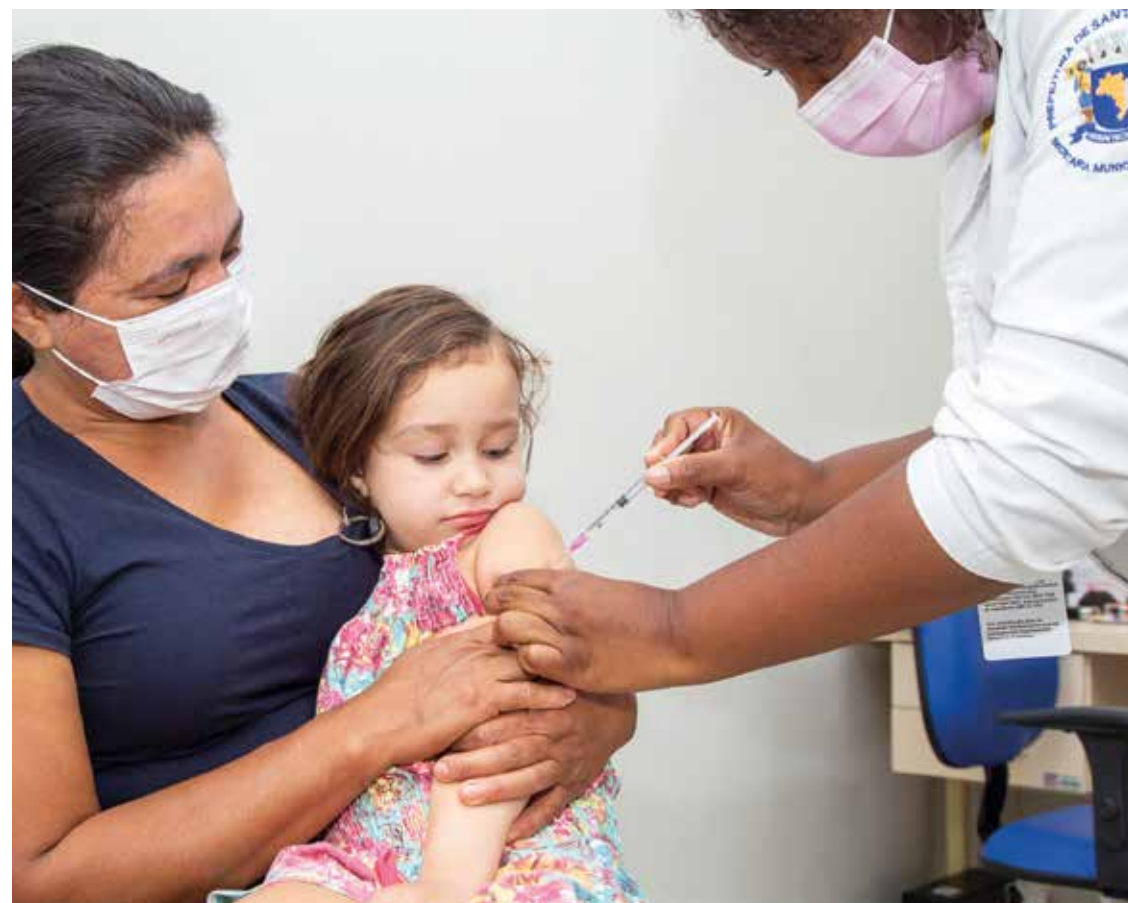
Morador que perder a carteirinha deve procurar a UBS ou USA onde costuma ser vacinado

F: 2424-2759 - Estrada do Sítio do Morro, 1.255 Parque Alvorada